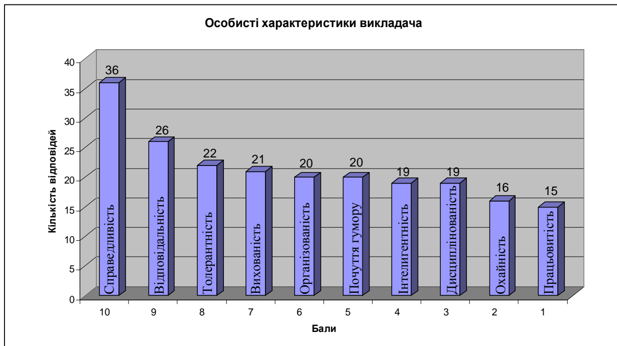
Рис. 1 Особисті характеристики викладача

Особистісні характеристики викладача у порядку спадання їхньої значимості респонденти розмістили наступним чином Рисунок 1. Приведена нижче діаграма висвітлює найбільшу кількість голосів по кожному запропонованому елементу.