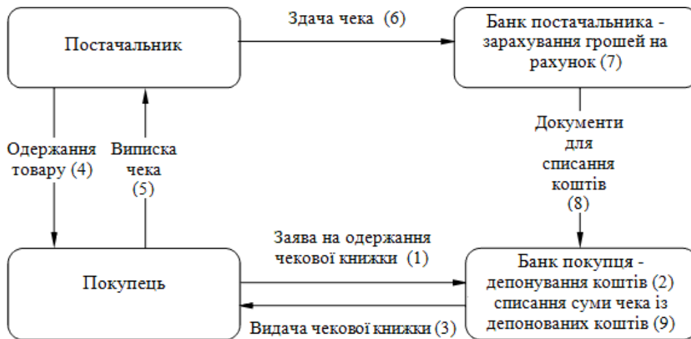
Рисунок 20.1. Механізм здійснення платежів за допомогою чеку